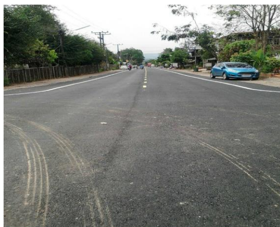
โครงการก่อสร้างปรับปรุงผิวจราจรถนน คสล.ณรงค์ราษฎร์สามัคคี