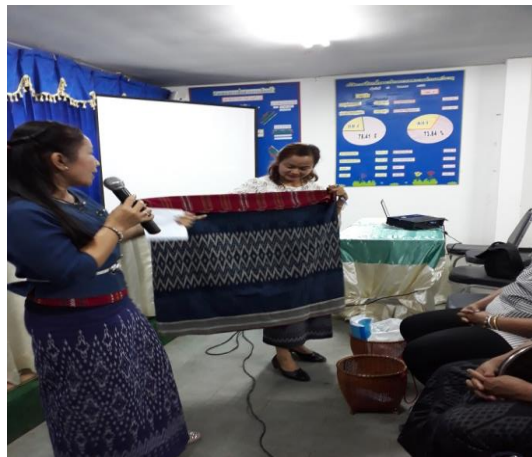
โครงการพัฒนาศักยภาพคณะกรรมการชุมชน